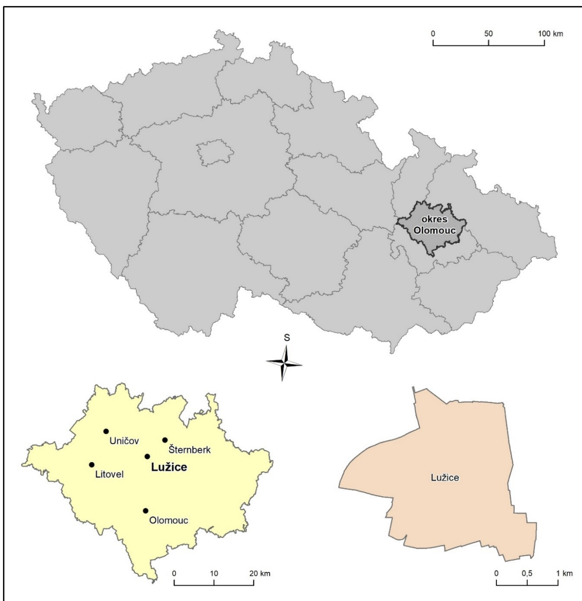
Lokalizace obce Lužice v rámci ČR, kraje a okresu